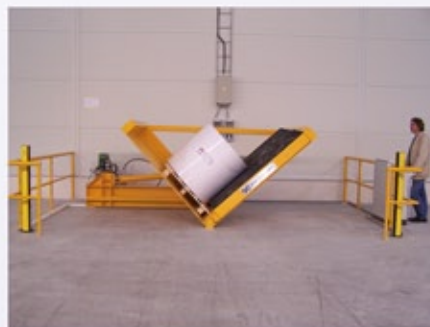
2. RK kippt Rolle um 90°