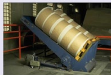
RK twin: mit Förderband für Einzelrollen integrierbar in Fördertechnik