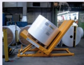
RK 100/400: nur mit Stapler Beschickbar