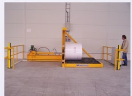
3. Rolle horizontal