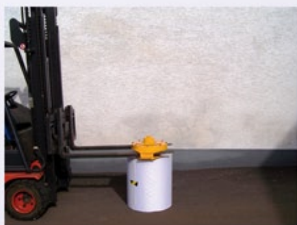
4. Absetzen, automatisches Umschalten auf Greifen