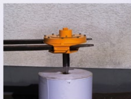
3. Einführen, Selbstzentrierung