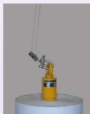
3. Absetzen, automatisches Spannen bei Schlaffseil