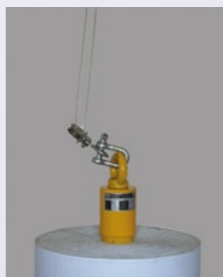
5. Absetzen, automatisches Lösen bei Schlaffseil